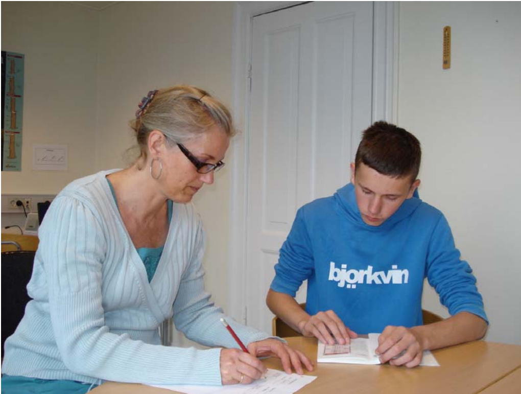
Elev og lærer gennemgår hvilke ord, som er blevet noteret og hvilken læsetid, eleven har læst på.